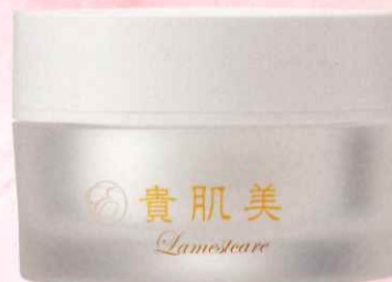
貴肌美 ラメステア ★部分用クリーム 30g 8,800円(税込9,680円)