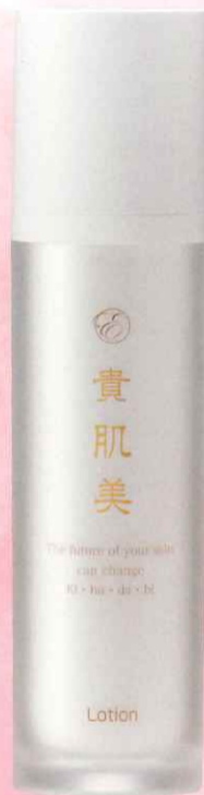
貴肌美 ローション 120mL 6,800円(税込7,480円)