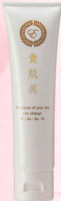
貴肌美 クリーム 100g 7,800円(税込8,580円)